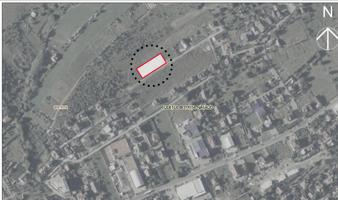
Plan de încadrare în teritoriu scara 1:5000